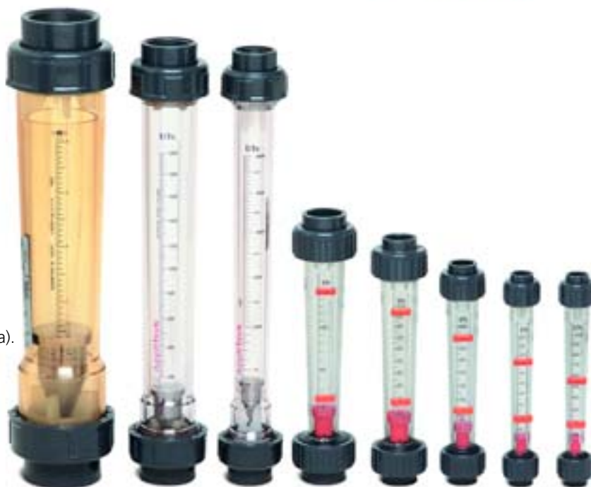
TABELA DE VAZÃO DOS ROTÂMETROS DA SÉRIE AP

Alarme de vazão de mínima ou máxima vazão, ou ambos.